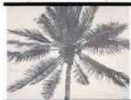
Tenture XL «Palm School Zoom», Home Autour du Monde, 45 €.