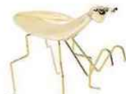
Insecte, Zara Home, 18 €.