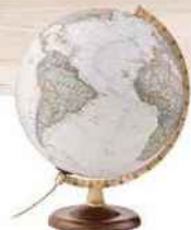
Globe «National Geographic Gold», Nature & Découvertes, 100 €.