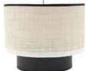
Suspension «Eclipse» en coton et rabane, Maison Sarah Lavoine, 280 €.